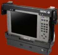
Araç kiti port çoklayıcı